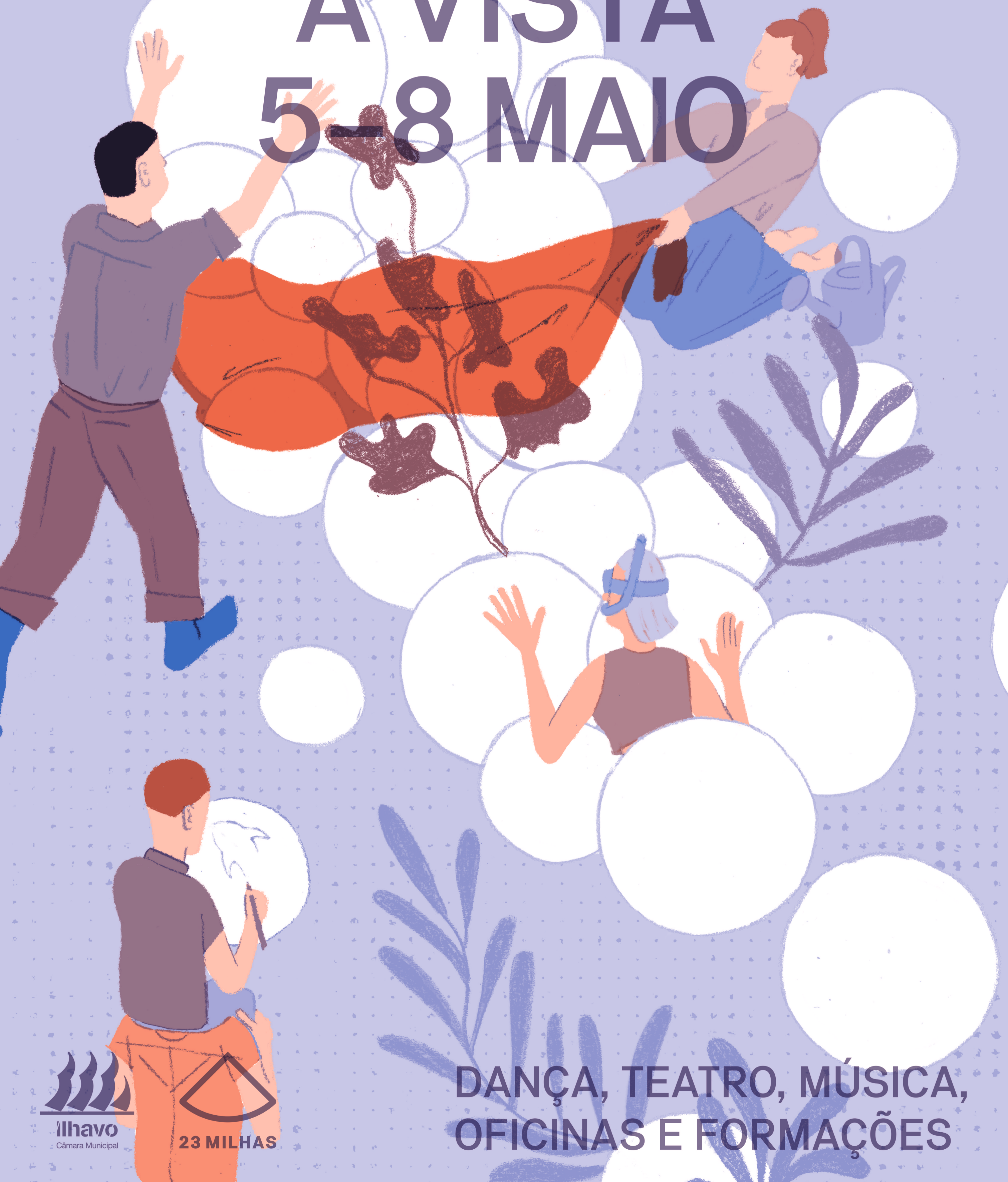
ILUSTRAÇÃO À VISTA 5-8 MAIO