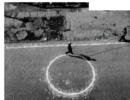
JOAN JONAS Songdelay (stills), 1973