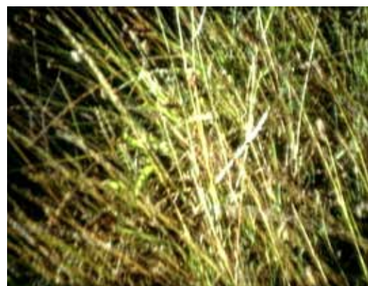
ÂNGELO DE SOUSA Flores Vermelhas (stills), 1974