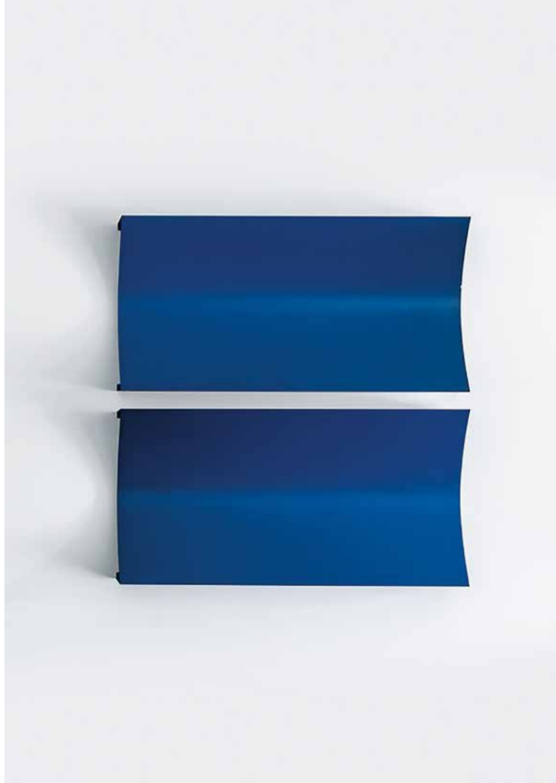
CHARLOTTE POSENENSKE Prototype Series B Relief, 1967