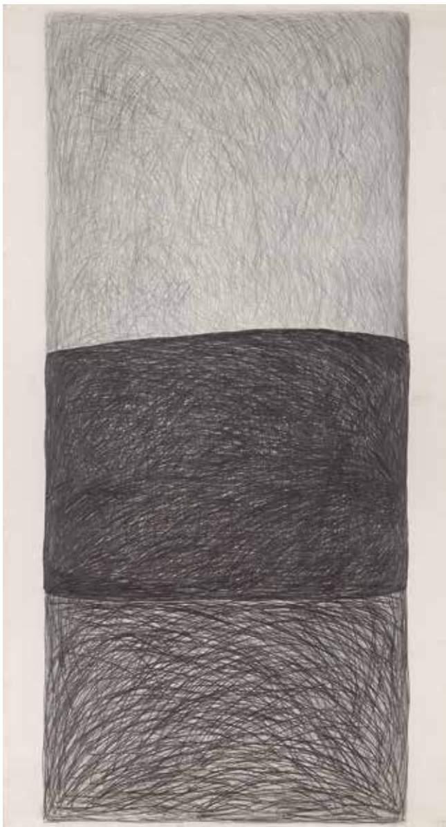
SEM TÍTULO 02 , 1982