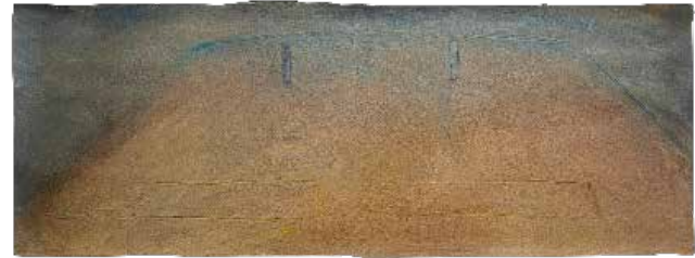
SEM TÍTULO , 1985 Grafite e tinta acrílica areada sobre papel 56 x 152 cm Col. Município de Aveiro