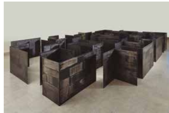
LABIRINTO DESLOCADO, 2021

Óleo sobre chapa de alumínio (28 elementos)