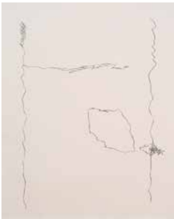
SÉRIE CADERNO DE DESENHO — RUA VAZIA SEM FIM, 2016