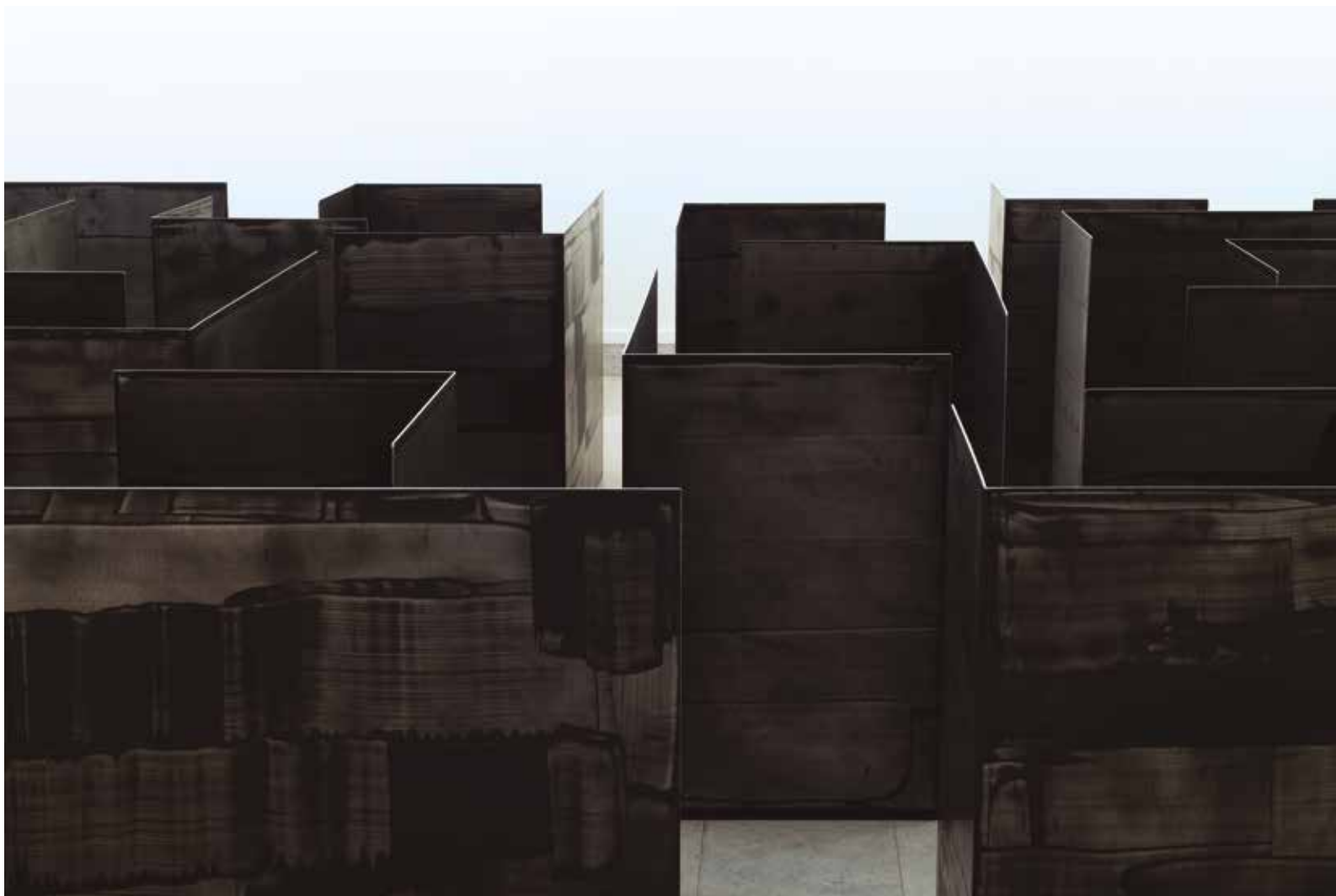
LABIRINTO DESLOCADO (DETALHE), 2021