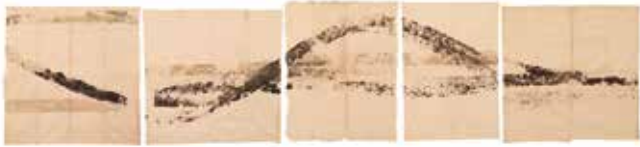
RODADO , 1979 Acrílico sobre tela (5 elementos) 144 x 650 cm aprox.