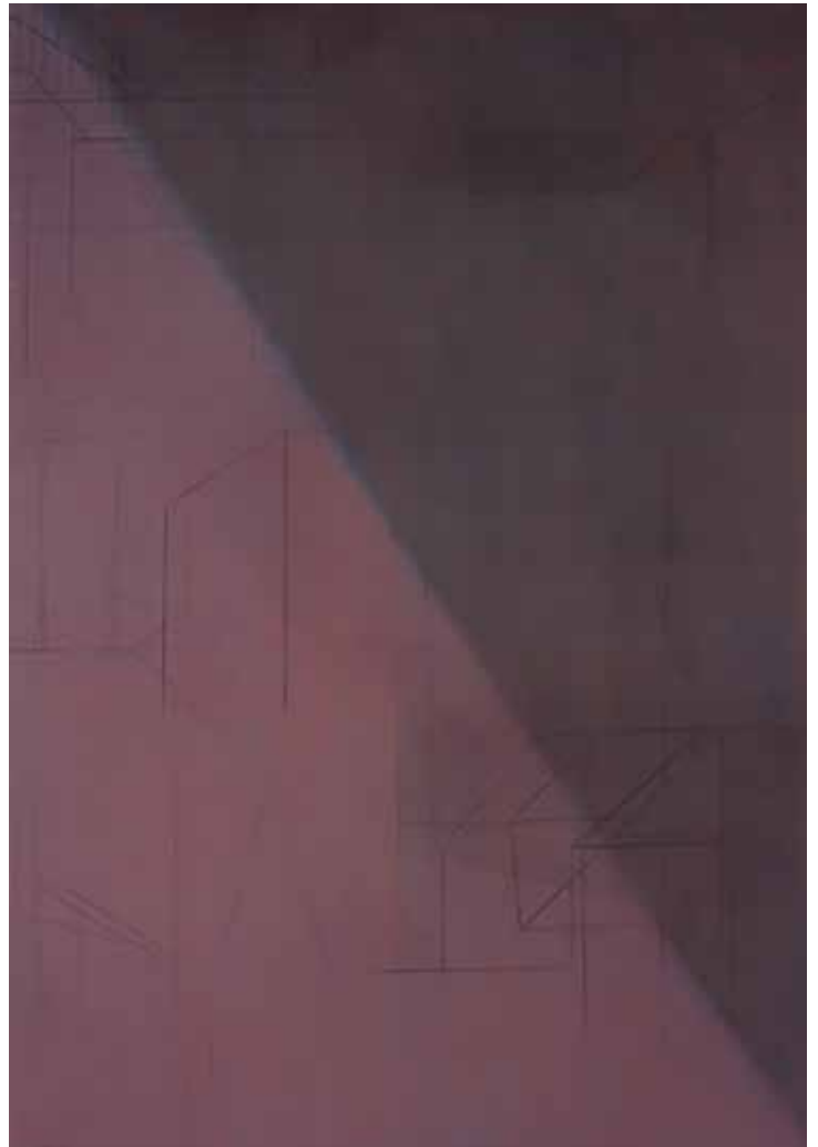
SEM TÍTULO 06 (DA SÉRIE "TRAVAIL DU PEINTRE"), 1987