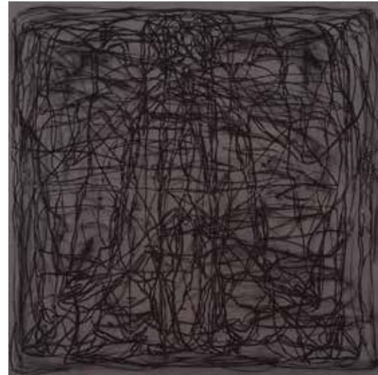
ESPÉCIE DE CORPO, 2020