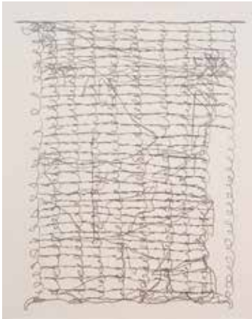
SÉRIE CADERNO DE DESENHO — DE REPENTE UM SEGREDO, 2016