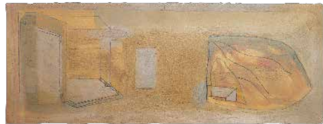
SEM TÍTULO , 1985 Grafite e tinta acrílica areada sobre papel 56 x 152 cm Col. Município de Aveiro