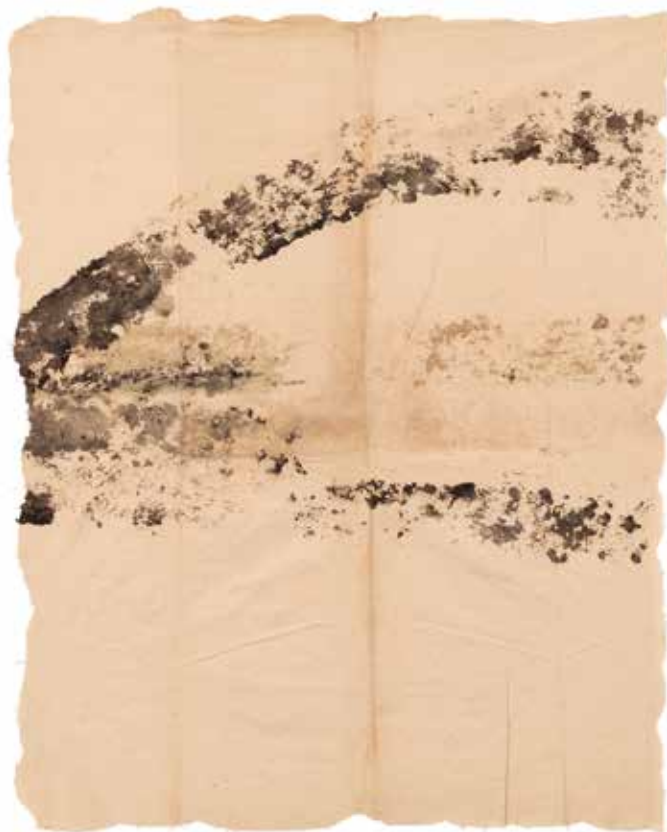
RODADO (DETALHE), 1979