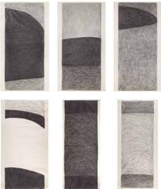
SEM TÍTULO 01 A 06 , 1982 Grafite sobre papel 282 x 152,7 cm / 282 x 152,5 cm / 281,5 x 152,5 cm 286,5 x 152,5 cm / 286 x 122,2 cm / 291,5 x 133 cm Col. Fundação de Serralves — Museu de Arte Contemporânea, Porto. Doação de Maria de Belém Sampaio em 2020