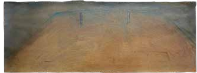
SEM TÍTULO , 1985 Grafite e tinta acrílica areada sobre papel 56 x 152 cm Col. Município de Aveiro