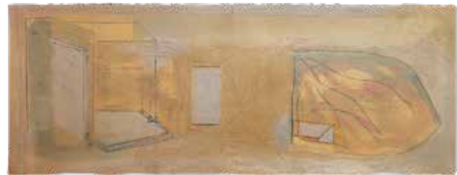
SEM TÍTULO , 1985 Grafite e tinta acrílica areada sobre papel 56 x 152 cm Col. Município de Aveiro