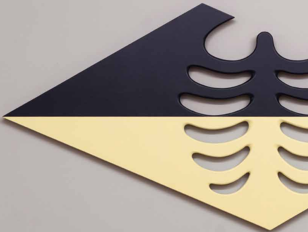
Braços abertos, 2019 (pormenor). Tinta acrílica sobre madeira. Open Arms, 2019 (detail). Acrylic paint on wood.