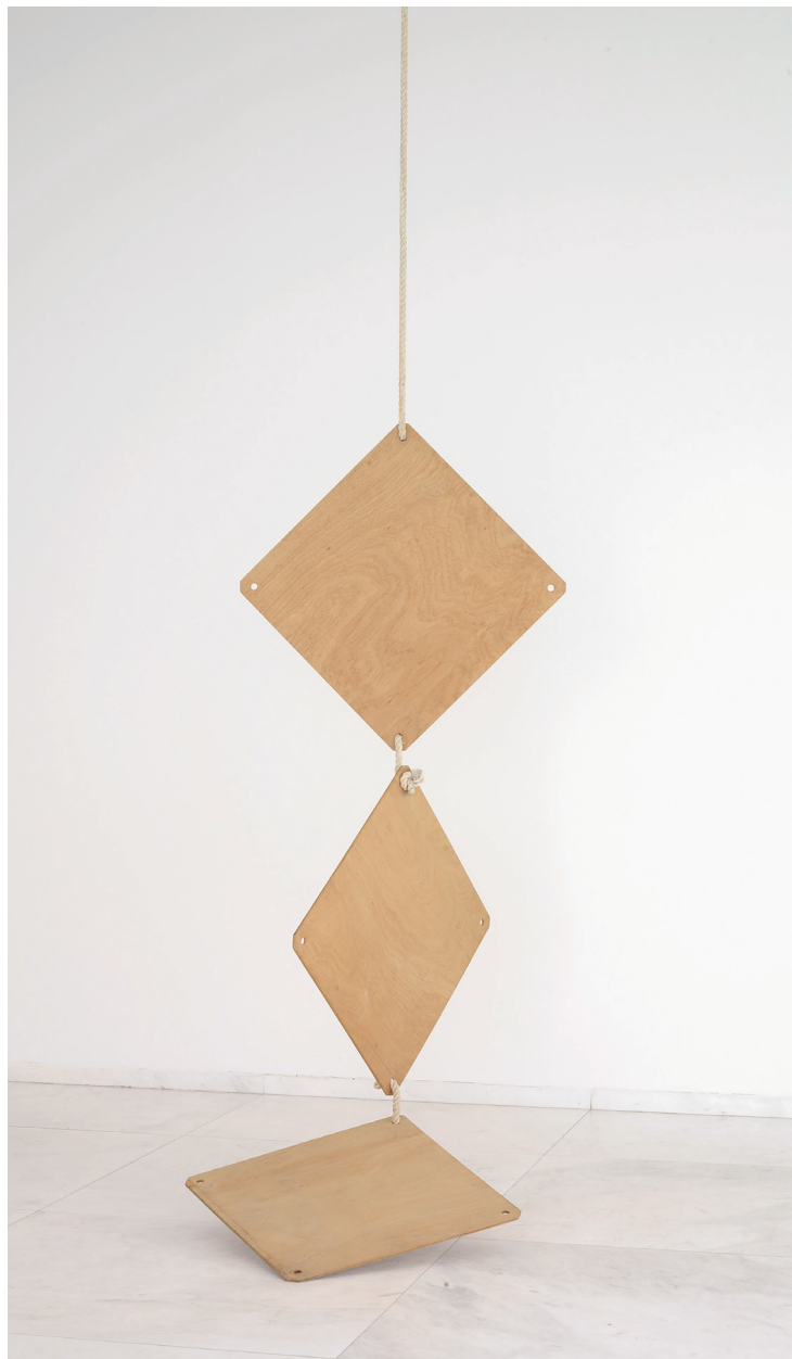
ÂNGELO DE SOUSA ESCULTURA, 1970