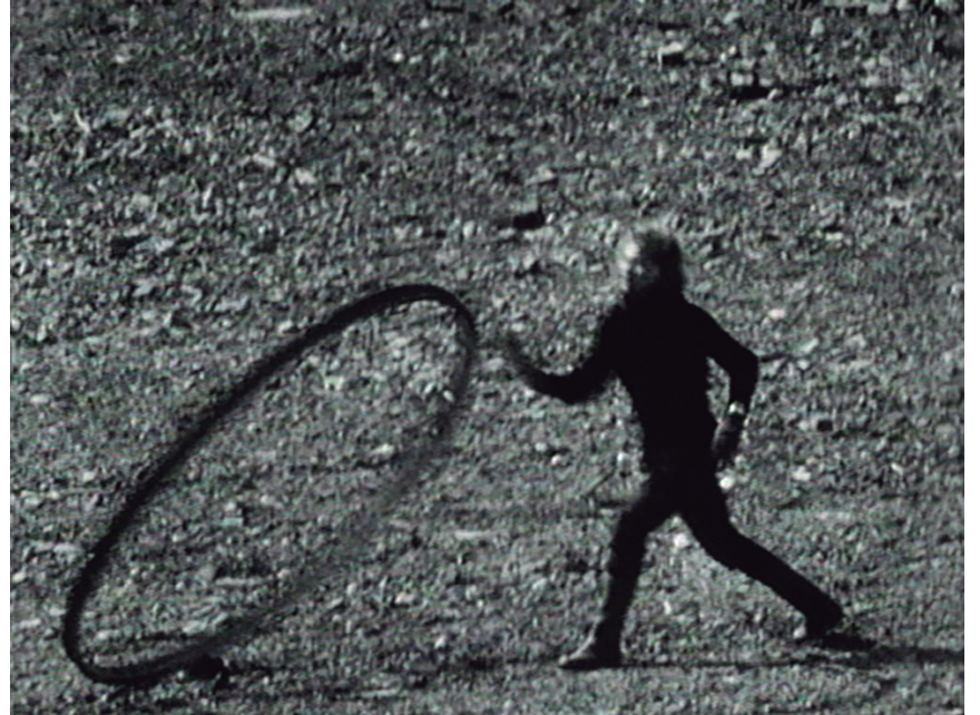
JOAN JONAS SONGDELAY, 1973