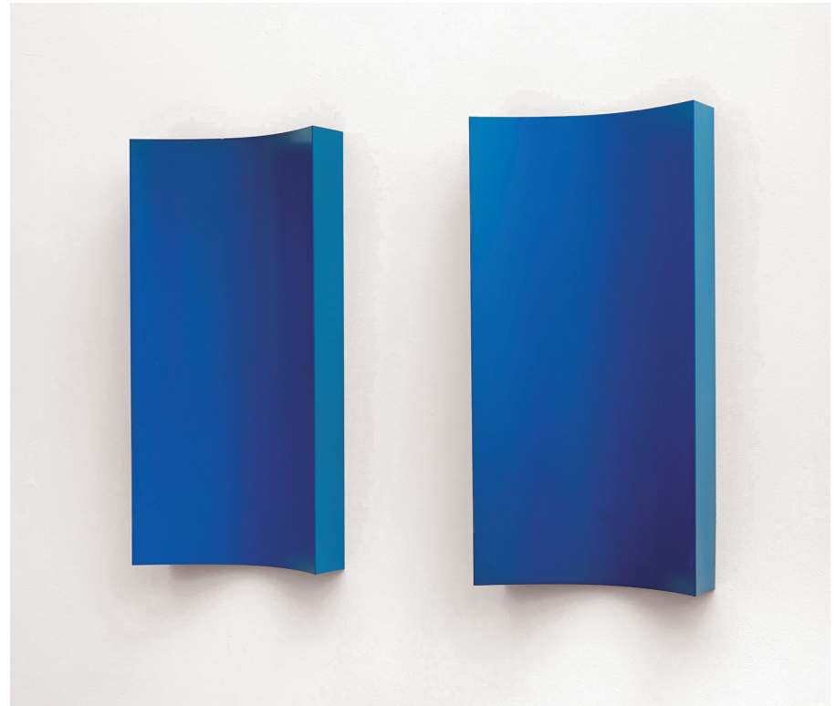
CHARLOTTE POSENENSKA PROTOTYPE SERIES B RELIEF, 1967