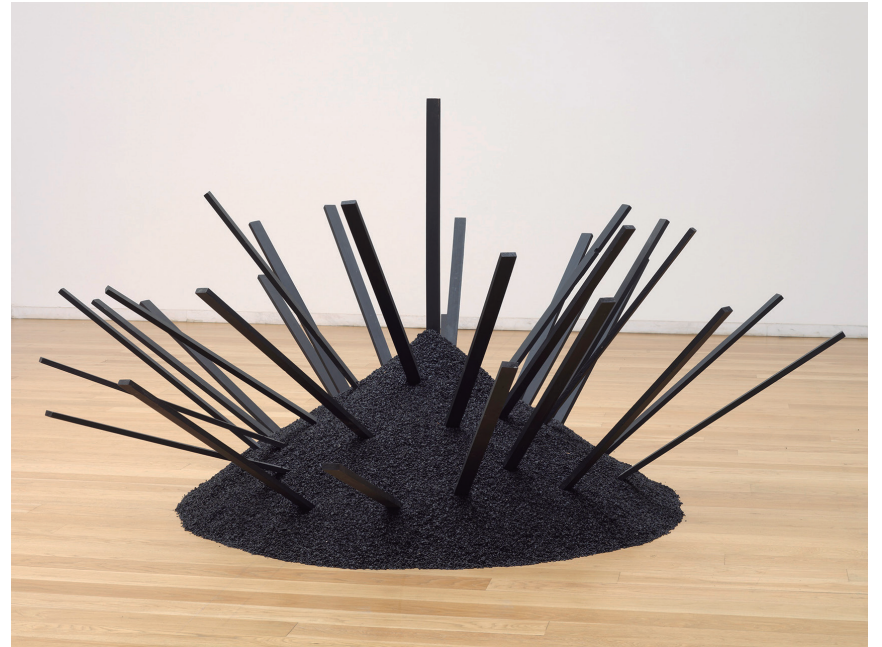
REINER RUTHENBECK ASCHEHAUFEN I - MIT LATTEN, 1968