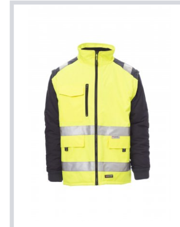
AMARELO FLUO/AZUL MARINHO