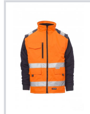
LARANJA FLUO/AZUL MARINHO