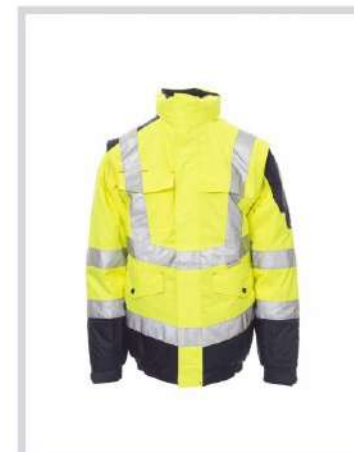
AMARELO FLUO/AZUL MARINHO