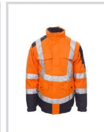
LARANJA FLUO/AZUL MARINHO