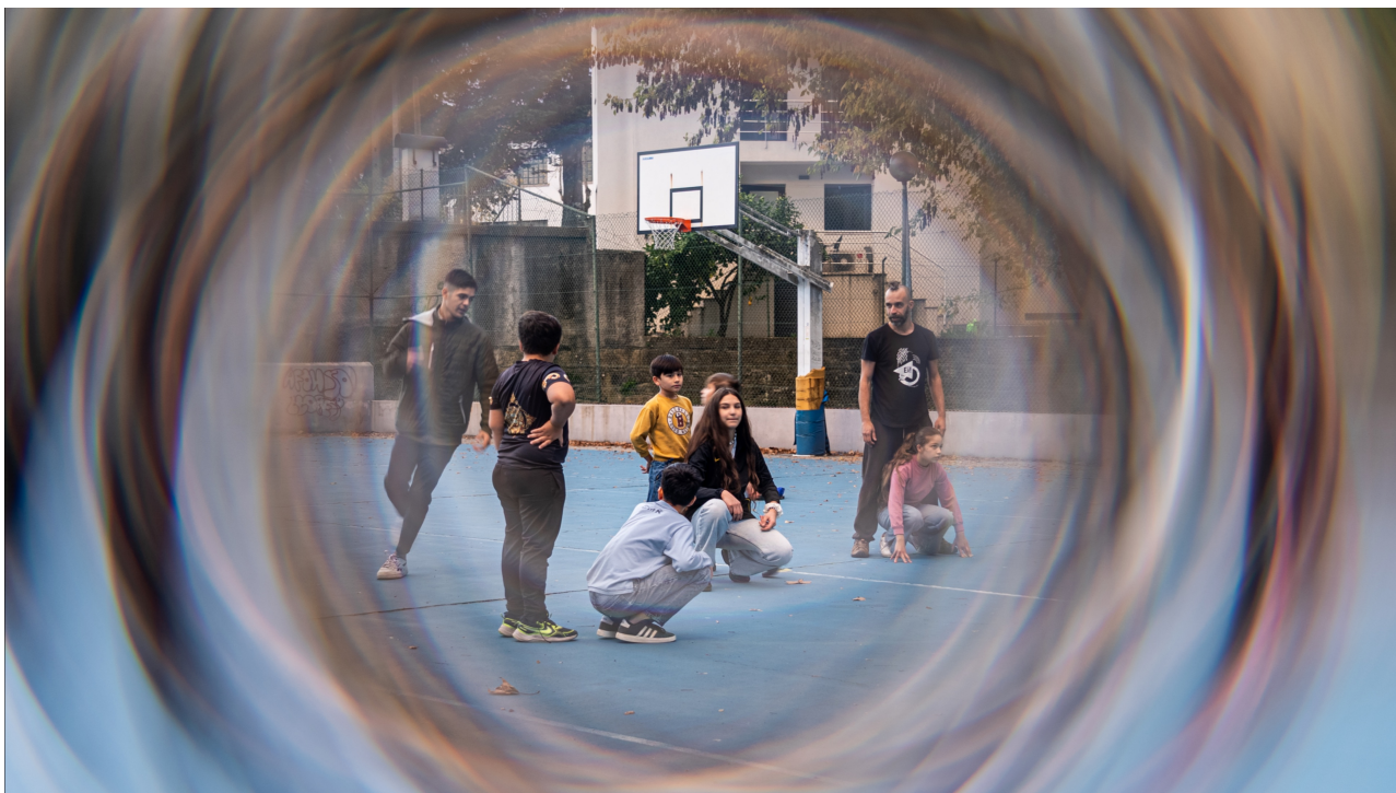
Soni Drom, oficinas artísticas em Viseu

Ao longo de janeiro, o projeto Soni Drom continua em Viseu com uma sequência de oficinas semanais, abrindo espaço para escuta, criação e relação com a cidade.