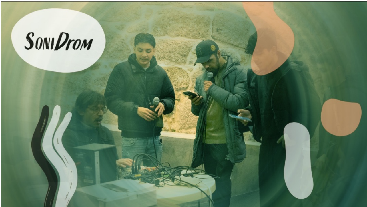
Soni Drom, oficinas artísticas em Viseu

“Soni Drom” é um projeto com jovens da comunidade cigana em Viseu que se faz por continuidade: oficinas semanais, tempo de pesquisa e experimentação, e uma criação coletiva que vai ganhando forma até à apresentação pública final.