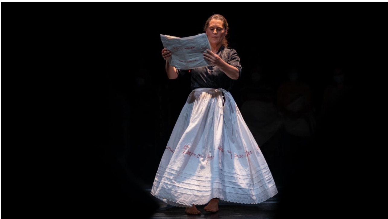
Compartilhamento de Matérias

Em curso desde 2023, o projeto entrou em nova fase em setembro de 2025, dedicada à pergunta “E em vez do medo?”. Essa etapa prossegue agora em outubro, dando continuidade ao trabalho com turmas e comunidade educativa.