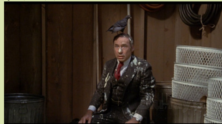
High Anxiet , Mel Brooks, EUA, 1977

Quantos ciclos de comédia enquanto género cinematográfico se vêem por aí? Poucos, muito poucos, sintoma de como o humor ainda é visto, redutoramente, como mero “entretenimento” ou forma de alienação (o que em si mesmo nada tem de pernicioso, diga-se em qualquer caso). Num tempo marcado pela incerteza, a escalada militar, a polarização e um sentimento crescente de medo colectivo, fazer comédia nos nossos dias é, de certo ângulo, um ato político; e rir é, podemos dizê-lo, mais do que um gesto profundamente natural e humano, um autêntico ato de resistência contra a normalização da violência, do autoritarismo e do desespero. É neste contexto que se propõe a realização de um ciclo de cinema dedicado a Mel Brooks (ainda vivo), de quem se celebram 100 anos em 2026, uma das grandes - mas mal-amadas - figuras da história do cinema cómico. Na dupla condição de realizador e ator dos seus filmes, Brooks construiu uma obra singular que alia o humor desregrado e desprezioso ao comentário e sátira políticos e culturais. Dialogando de forma direta com a história do cinema, através de uma paródia de géneros clássicos (musical, western, terror, suspense, policial), e desmontando os códigos do cinema clássico e popular (que, importa sublinhar, ele ama e admira), Brooks mostra como as imagens moldam o nosso imaginário colectivo e como o humor pode expor os mecanismos do poder, propaganda e exclusão.