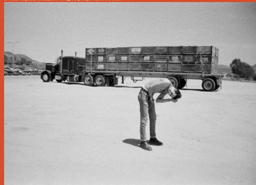
© Victor Torpedo, Nevada, 1997. Integra exposição Call of the West

Nesta Escuta Ativa, Victor Torpedo estará à conversa com Nazaré e Eduardo Pinela (Capitão Fantasma), Paula Guerra e Andy Bennett. No final, será exibido o documentário The Parkinsons: A Long Way to Nowhere (2016), de Caroline Richards.