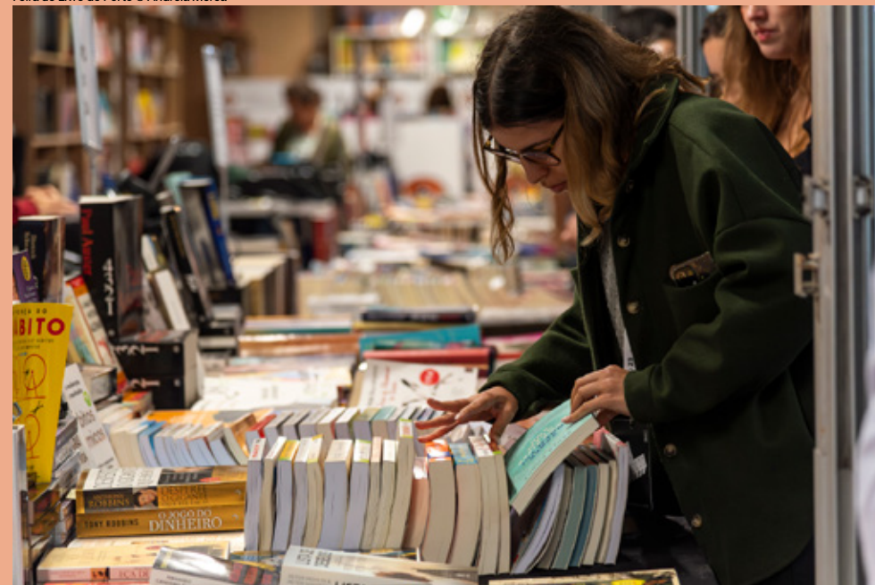
Feira do Livro do Porto