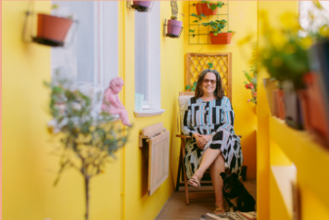
Atelier Amarelo

A parte da frente tornou-se o seu estúdio que, sempre que organiza um evento, transforma facilmente em espaço expositivo. "Quando tenho uma exposição, basta puxar as cortinas. Instalei ganchos especiais no tecto para pendurar as obras e funciona muito bem."