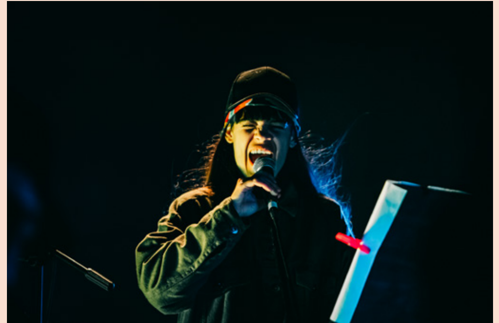
Puçanga © Pedro Jafuno.