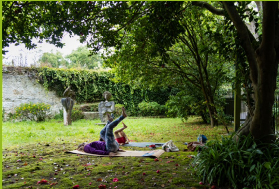
Mini Zen, 2025

A aula de ioga começa às 10h00 e dura uma hora. Logo depois, às 11h00, decorre a aula de meditação, com a mesma duração. As duas propostas são adaptadas às idades dos destinatários e orientadas por profissionais habilitados para o efeito.