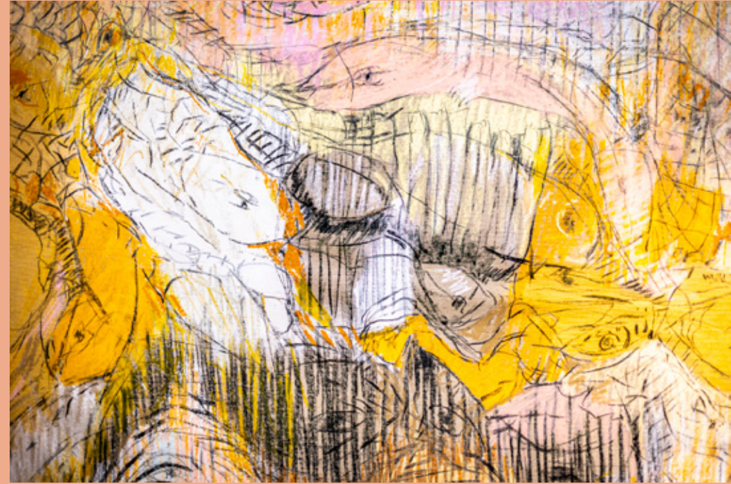
Galeria Catapulta