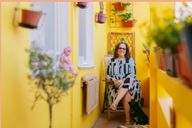
Atelier Amarelo

A parte da frente tornou-se o seu estúdio que, sempre que organiza um evento, transforma facilmente em espaço expositivo. "Quando tenho uma exposição, basta puxar as cortinas. Instalei ganchos especiais no tecto para pendurar as obras e funciona muito bem."