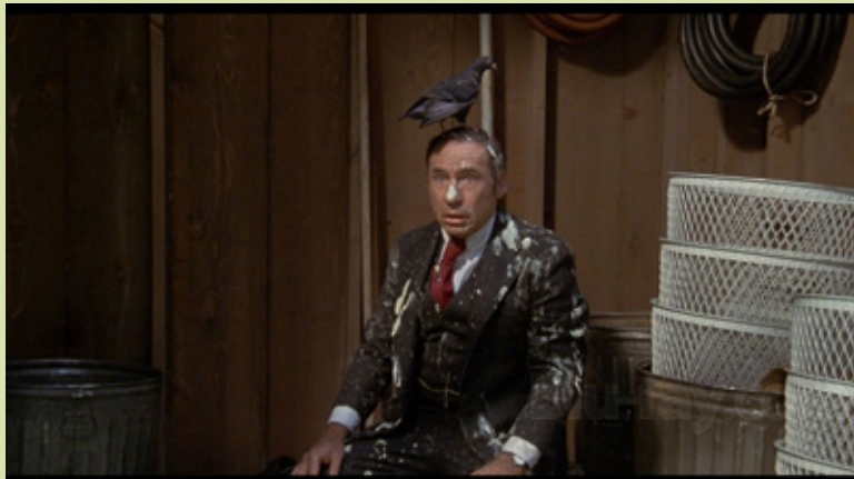
High Anxiety , Mel Brooks, EUA, 1977

Quantos ciclos de comédia enquanto género cinematográfico se vêem por aí? Poucos, muito poucos, sintoma de como o humor ainda é visto, redutoramente, como mero “entretenimento” ou forma de alienação (o que em si mesmo nada tem de pernicioso, diga-se em qualquer caso). Num tempo marcado pela incerteza, a escalada militar, a polarização e um sentimento crescente de medo colectivo, fazer comédia nos nossos dias é, de certo ângulo, um ato político; e rir é, podemos dizê-lo, mais do que um gesto profundamente natural e humano, um autêntico ato de resistência contra a normalização da violência, do autoritarismo e do desespero. É neste contexto que se propõe a realização de um ciclo de cinema dedicado a Mel Brooks (ainda vivo), de quem se celebram 100 anos em 2026, uma das grandes - mas mal-amadas - figuras da história do cinema cómico. Na dupla condição de realizador e ator dos seus filmes, Brooks construiu uma obra singular que alia o humor desregrado e desprezioso ao comentário e sátira políticos e culturais. Dialogando de forma direta com a história do cinema, através de uma paródia de géneros clássicos (musical, western, terror, suspense, policial), e desmontando os códigos do cinema clássico e popular (que, importa sublinhar, ele ama e admira), Brooks mostra como as imagens moldam o nosso imaginário colectivo e como o humor pode expor os mecanismos do poder, propaganda e exclusão.