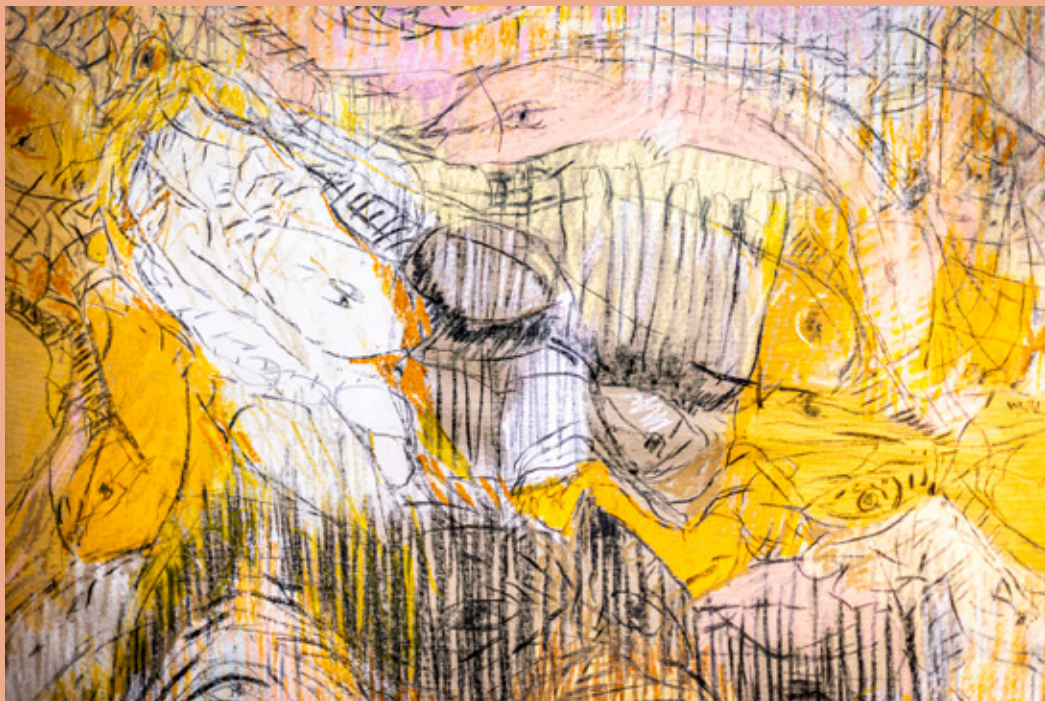
Galeria Catapulta