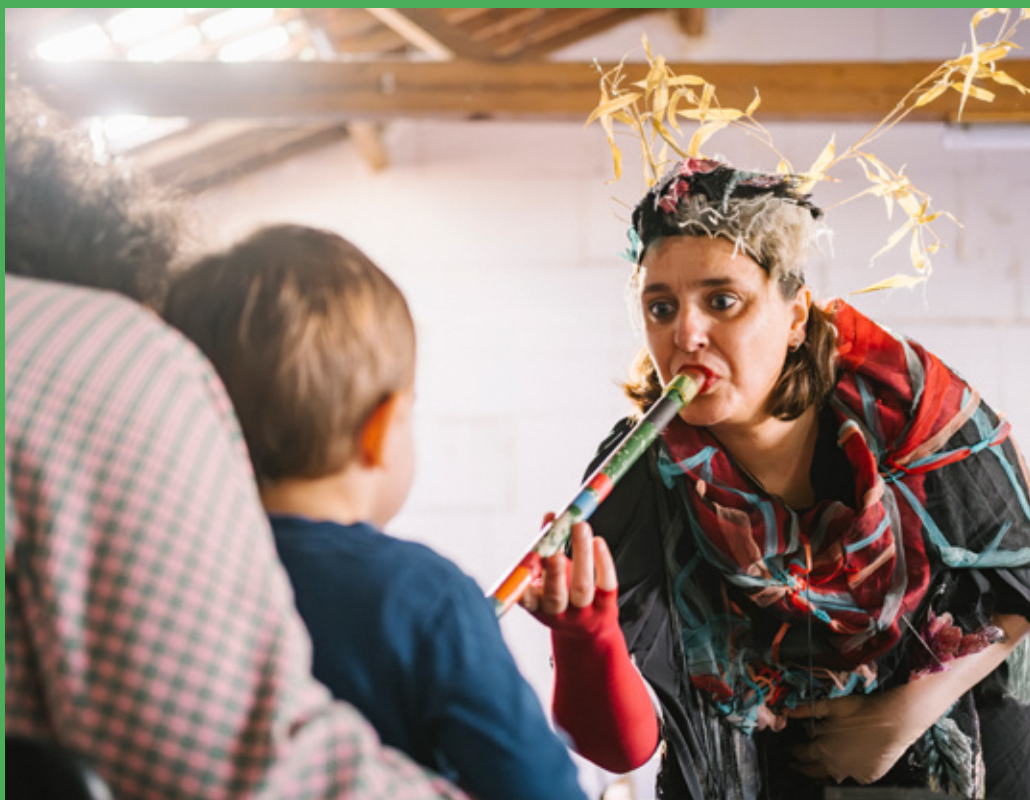
HÁ-Vento, O Som do Algodão

Especialistas em ouvir, os bebés são cada vez mais protagonistas da oferta cultural da cidade. Amplamente procuradas, e recorrentemente esgotadas, as sessões de música para bebés são momentos de contemplação e partilha entre famílias que permitem fortalecer laços e cultivar a sensibilidade perante a arte e o outro. A Agenda Porto apresenta seis projetos que dão música à pequenada.