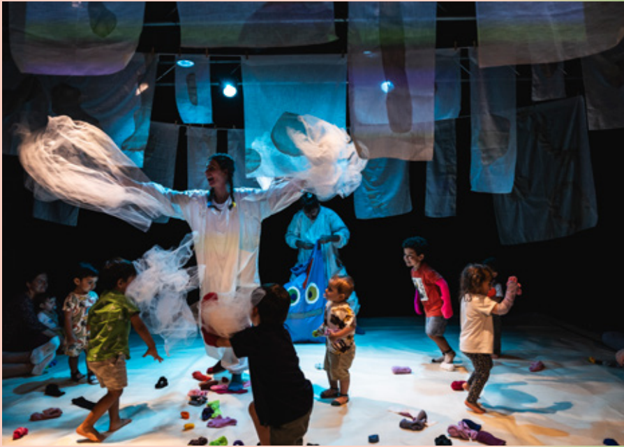
Bebé em Cena, Espaço Aurora

No Semente, não há uma atividade musical per se , mas o som está associado às ações realizadas, nomeadamente através de uma playlist curada para “entrar no ambiente, animar um bocadinho ou acalmar um pouco”, respetivamente. Já no Palco, são tocadas canções originais e de outros autores com recurso aos instrumentos feitos com objetos comuns, que podem igualmente ser exploradas pelos bebés. “Temos um que é todo com cápsulas de café, do [espetáculo] Estado de Pássaro , que faz um som incrível.”