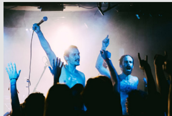
Baleia Baleia Baleia

Com curadoria de Rui Garcia, um dos elementos dos Bulha, a Noite do Cometa será um evento trimestral que pretende “criar palco para dar visibilidade a projetos musicais mais alternativos e experimentais”.