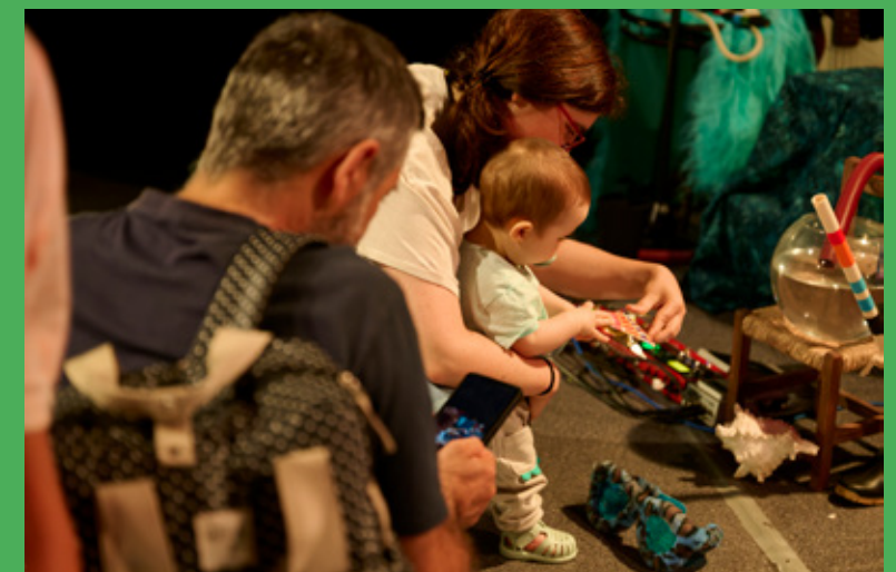
HÁ-Vento, O Som do Algodão

Atualmente, o Música com a Eva dinamiza sessões em espaços como o PlayLab Porto – a próxima, intitulada “A minha Mãe é uma floresta”, decorre no dia 10 às 10h00 –, creches, estabelecimentos de pré-escolar e em festas de aniversário. “Cada vez mais se sente a necessidade de pais e filhos terem tempo e espaço para estarem juntos e fortalecerem vínculos sem distrações.”