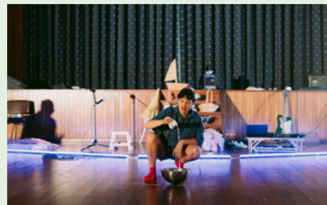
Há um Rio nesta Gota , Frenesim

Nano Mini Micro – Festival para a Infância do Porto é a nova programação dedicada a bebés, crianças e famílias que acontece na Biblioteca Municipal Almeida Garrett. Com entrada gratuita, o programa distribui-se ao longo de vários meses e reúne propostas de teatro, música, narração oral, oficinas e performance, envolvendo estruturas artísticas e criadores ligados à cidade e ao contexto nacional. Em maio, estão marcadas seis atividades: no dia 2, às 11h00, Saber ir ao fundo , e no dia 3, às 10h30 e às 11h30, Há um Rio nesta Gota , ambos os espetáculos pela companhia Frenesim; no dia 16, às 11h00, a oficina de ilustração Livro Livre , com a ilustradora para a infância e designer gráfica Danuta Wojciechowska; a 23, a oficina de serigrafia Manifesto Poético com o Atelier SER e o Giro – Art on Wheels; a 30 e 31, às 11h00, o espetáculo para bebés e famílias WAKA , e às 14h00, Rebuliços de Histórias na Primavera , que junta cinco contadoras de histórias. Toda a programação em agenda.porto.pt e em bibliotecasdoporto.pt.