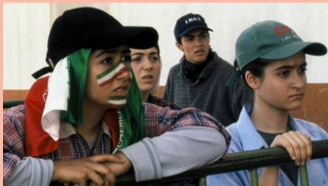
Offside, de Jafar Panahi

Adotando o título do filme de Ida Lupino, de 1951, sobre uma jogadora de ténis e o seu lugar no mundo da competição, Hard, Fast and Beautiful percorre décadas, géneros e culturas de cinema para falar, principalmente, sobre a transcendência através do desporto. — BCC