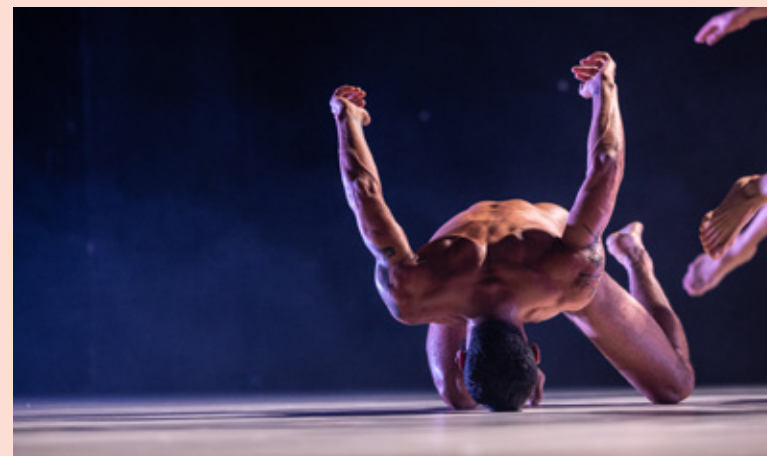
Há Qualquer Coisa Prestes a Acontecer