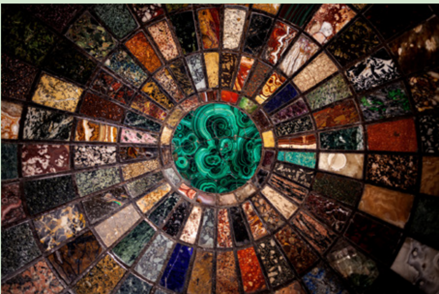
Mesa de Biblioteca de João Allen, Autor desconhecido, 1830 / Coleção Museu Romântico

Celebrado a 18 de maio, o Dia Internacional dos Museus assume este ano como tema Museus unindo um mundo dividido para sublinhar a sua importância enquanto espaços de diálogo, inclusão e cultura de paz, capazes de estender pontes entre culturas num mundo cada vez mais marcado pela polarização.