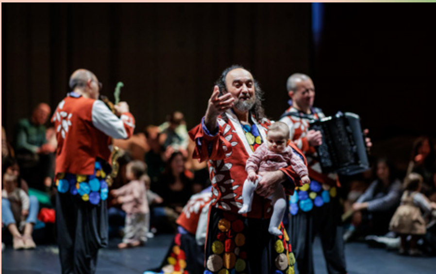
Paulo Lameiro © Casa da Música