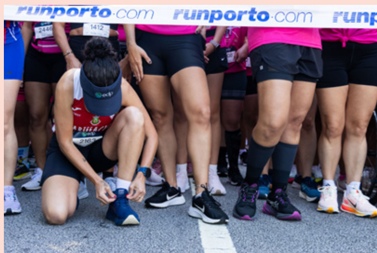
Corrida da Mulher, 2025

As inscrições estão abertas até às 23h59 do dia 19 de maio em runporto.com. Os kits de participação podem ser levantados no Centro Comercial Alameda Shop & Spot, a 22 e 23 de maio, entre as 10h00 e as 23h00. — G.M.