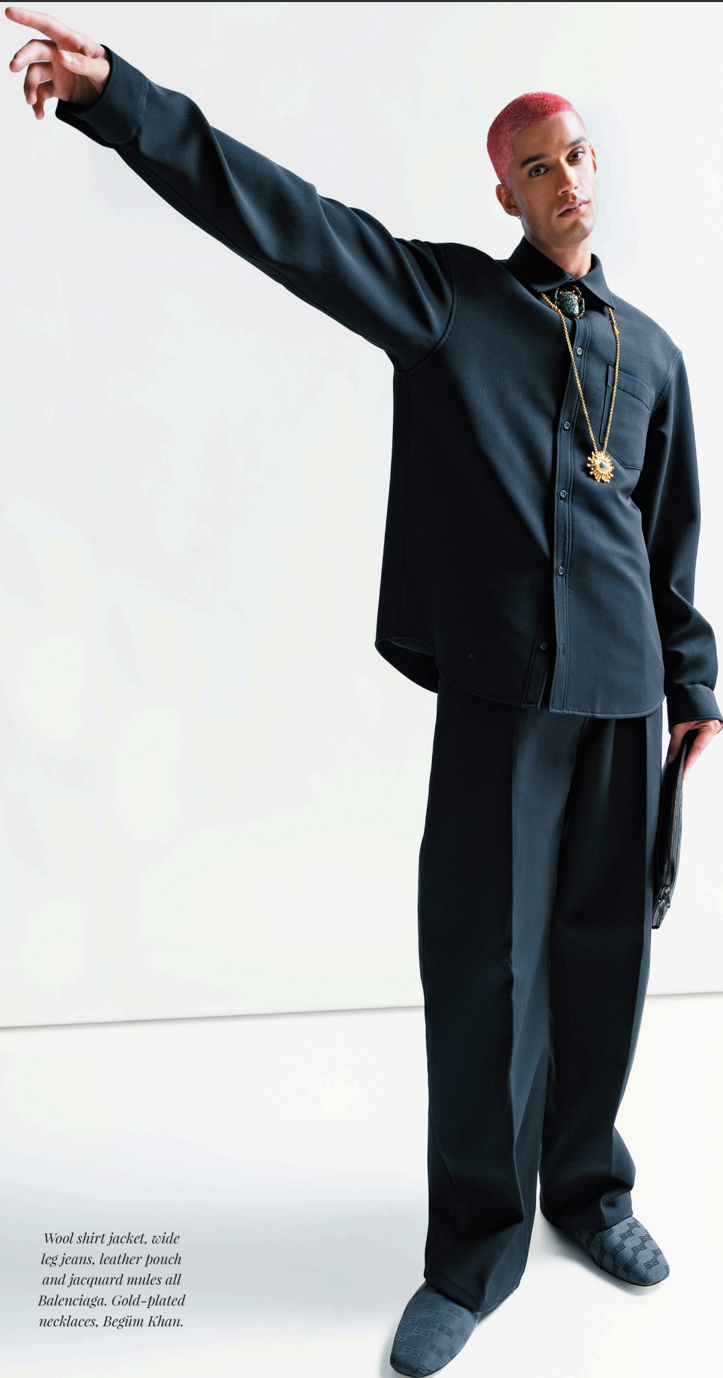
Wool shirt jacket, wide leg jeans, leather pouch and jacquard mules all Balenciaga. Gold-plated necklaces, Begüm Khan.